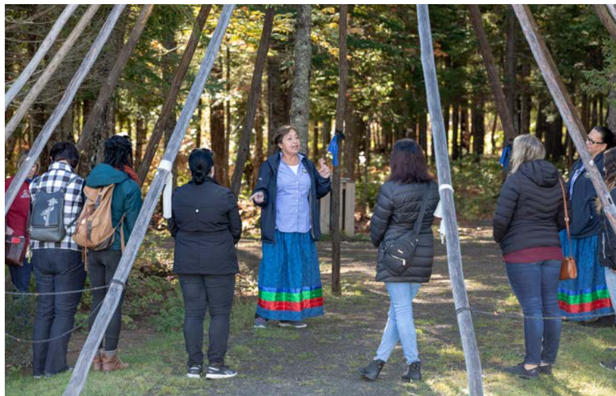
Photo, cette page : Elisipogtog Mi'kmaq Cultural Centre, N-B. Photo, quatrième de couverture : Pollen Nation Farm, T-N-L

Soumettez une demande en ligne sur JoinITAC.ca